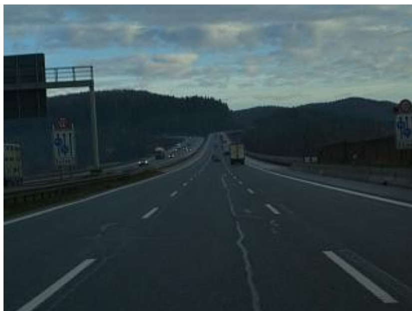
Beeindruckende Fahrt... mit einer sich teilenden Autobahn

Freitag, 24. November 2006, 08:30 Uhr. Wir fuhren weiter um die restlichen 250 Kilometer noch rasch hinter uns zu bringen. Dazu trafen wir uns auf dem ersten grossen Rastplatz zu Kaffee und Kuchen. Danach fuhren wir auf der 3-spurigen Autobahn mitten durch das riesige Deutschland in Richtung Osten. Die Reise wurde nun da es Tag war, einiges interessanter und wir sahen auch die zum Teil beeindruckende Landschaft. So kamen wir dann, die einten mit mehr, die anderen mit weniger Schlaf zur Mittagszeit vor der Messehalle in Chemnitz an.