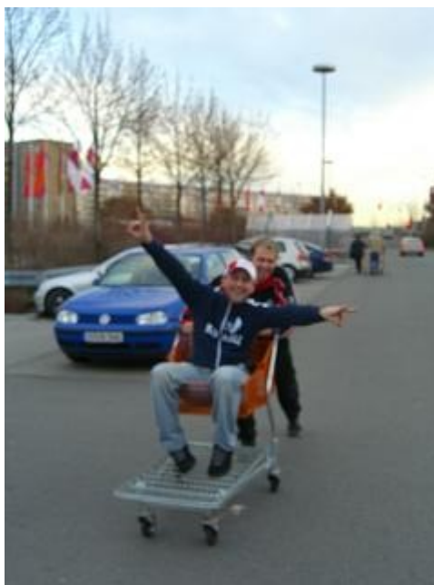
Ausflug in den Baumarkt... die spinnen die Schweizer

Nach der Pause um 18:00 Uhr ging es dann mit der grossen Eröffnungsfeier weiter und sie war beeindruckend. Die Grösse der Halle, die über 5000 Zuschauer und die vielen Sportler aus über 20 Nationen. Danach begannen die ersten Spiele der Gruppe A und als die Deutsche Mannschaft das erste Mal in den Hexenkessel einfuhr war der Lärm Ohrenbetäubend! Als danach die Schweizer auf das Spielfeld kamen, zeigten der über 400 Mann starke Schweizer Fanblock, was sie alles drauf hatten. Ein rot-weisses Fahnen und T-Shirt Meer. Begleitet von 6 Treichlern, die mit ihren Glocken einen ebenso riesen Lärm verursachten!