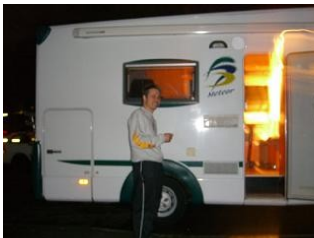
Rast auf einem Autohof...

Die Deutsche Mannschaft qualifizierte sich auch für den Final und so spielten sie dann dort um ca. 17:00 Uhr gegen die starken Tschechen. Dieser Final war äusserst einseitig und die Deutschen gewannen ihn auch hoch. Somit gab es im Radball wiederum keine Medaille für die CH und wir konnten uns „nur“ über zwei Bronzene der Kunstradfahrerinnen freuen. Anschliessen trafen wir uns bei den Wohnmobilen und fuhren um ca. 18:15 Uhr wieder in unsere Richtung. Diesmal lief es einiges besser als auf der Hinreise. Dies obwohl der Verkehr auf der Autobahn am Sonntagabend an den Verkehr bei uns zu den besten Stosszeiten erinnerte. In Deutschland darf man halt auch mit den Lastwagen am Wochenende fahren.