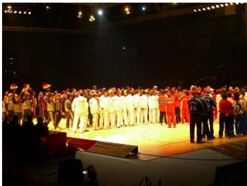
Einmarsch der Delegationen zur Eröffnungsfeier

Nach der Pause um 18:00 Uhr ging es dann mit der grossen Eröffnungsfeier weiter und sie war beeindruckend. Die Grösse der Halle, die über 5000 Zuschauer und die vielen Sportler aus über 20 Nationen. Danach begannen die ersten Spiele der Gruppe A und als die Deutsche Mannschaft das erste Mal in den Hexenkessel einfuhr war der Lärm Ohrenbetäubend! Als danach die Schweizer auf das Spielfeld kamen, zeigten der über 400 Mann starke Schweizer Fanblock, was sie alles drauf hatten. Ein rot-weisses Fahnen und T-Shirt Meer. Begleitet von 6 Treichlern, die mit ihren Glocken einen ebenso riesen Lärm verursachten!